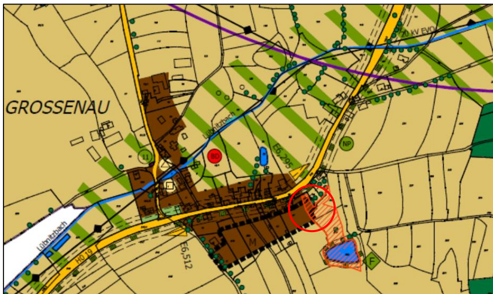
Abbildung 1: Entwurf vom 20.04.2023

Die frühzeitige Beteiligung der Öffentlichkeit und der Träger der öffentlichen Belange fand in der Zeit vom 01.10.2021 bis 02.11.2021 statt. Aufgrund der gemachten Anregungen und Einwände wurde der ursprüngliche Entwurf vom 09.06.2021 überarbeitet. Der Marktgemeinderat hat in seiner Sitzung vom 28.04.2023 die Einwände und Anregungen behandelt, den überarbeiteten Planentwurf in der Fassung vom 20.04.2023 gebilligt und die öffentliche Auslegung beschlossen. Der Planentwurf lag im Zeitraum 12.06.2023 bis 11.07.2023 öffentlich aus. Im Rahmen der öffentlichen Auslegungen wurden Anregungen und Einwände gemacht, auf Grundlage derer der ursprüngliche Entwurf vom 20.04.2023 überarbeitet worden ist. Der Marktgemeinderat hat in seiner Sitzung vom 22.12.2023 die Einwände und Anregungen behandelt, den überarbeiteten Planentwurf in der Fassung vom 17.11.2023 gebilligt und die erneute öffentliche Auslegung beschlossen.