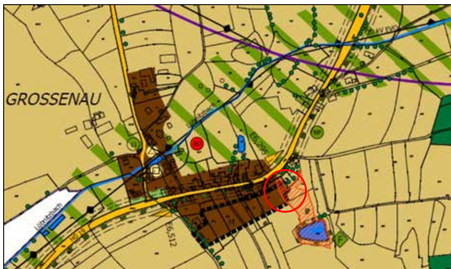
Abbildung 1: Entwurf vom 20.04.2023

Die frühzeitige Beteiligung der Öffentlichkeit und der Träger der öffentlichen Belange fand in der Zeit vom 01.10.2021 bis 02.11.2021 statt. Aufgrund der gemachten Anregungen und Einwände wurde der ursprüngliche Entwurf vom 09.06.2021 überarbeitet. Der Marktgemeinderat hat in seiner Sitzung vom 28.04.2023 die Einwände und Anregungen behandelt, den überarbeiteten Planentwurf in der Fassung vom 20.04.2023 gebilligt und die öffentliche Auslegung beschlossen. Der Planentwurf lag im Zeitraum 12.06.2023 bis 11.07.2023 öffentlich aus. Im Rahmen der öffentlichen Auslegungen wurden Anregungen und Einwände gemacht, auf Grundlage derer der ursprüngliche Entwurf vom 20.04.2023 überarbeitet worden ist. Der Marktgemeinderat hat in seiner Sitzung vom 22.12.2023 die Einwände und Anregungen behandelt, den überarbeiteten Planentwurf in der Fassung vom 17.11.2023 gebilligt und die erneute öffentliche Auslegung beschlossen.